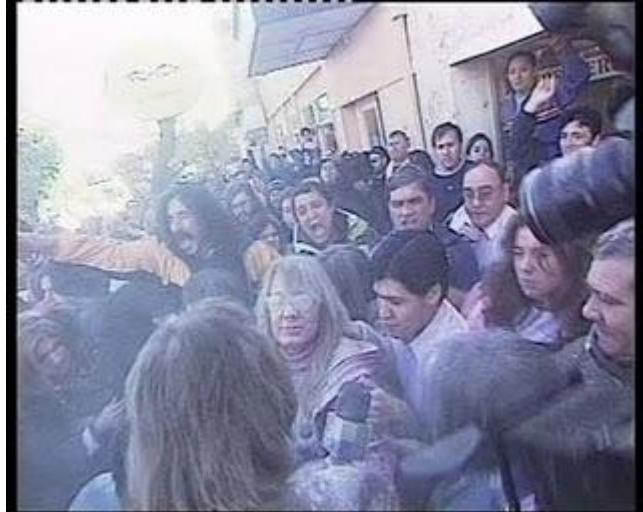
Agresor 1 I- R.bmp