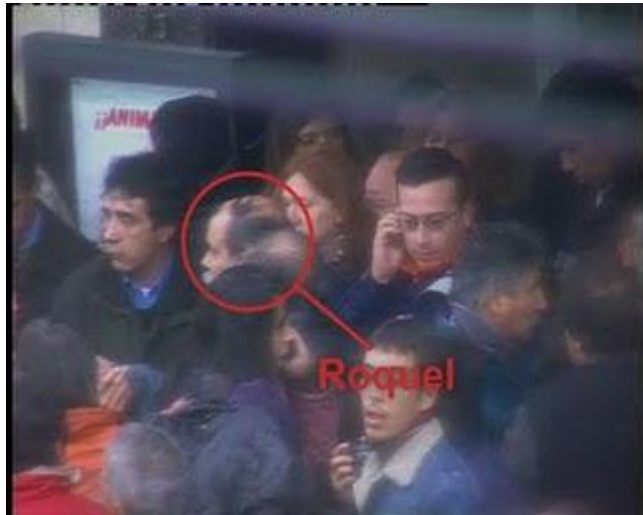
R-Secuen 6-Biott-Roquel .bmp