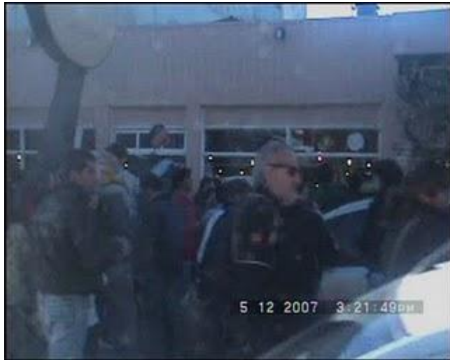
Escrache 11 DIP.bmp