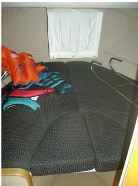
08.JPG (1.30 MB)