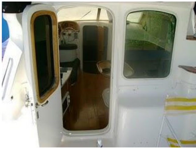
04.JPG (1.35 MB)