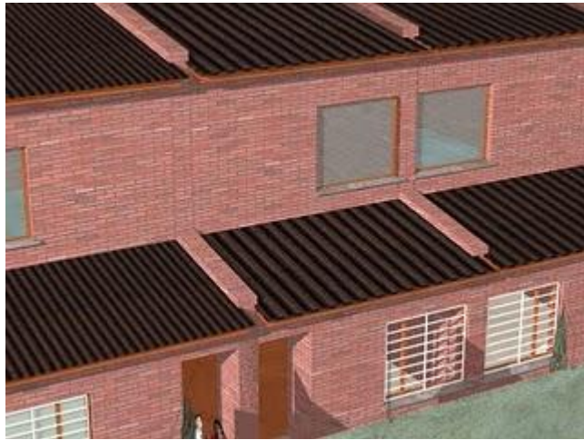
03.jpg (0.45 MB)