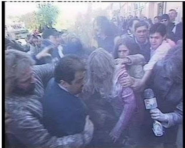
Agresora 2- R .bmp