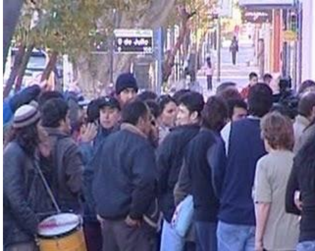
Agresores 1 y 2 Juntos- R.bmp