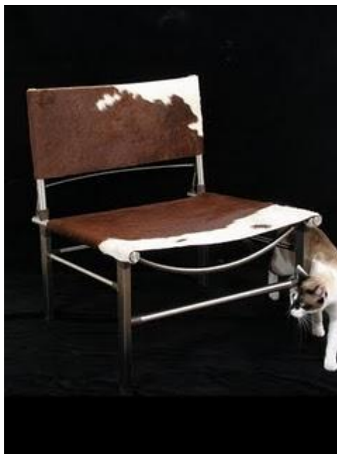
banquetas y mesa.jpg