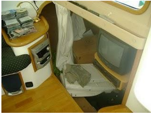
03.JPG (1.28 MB)