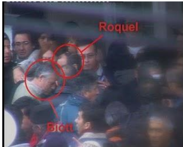
R-Secuen 2-Biott-Roquel .bmp