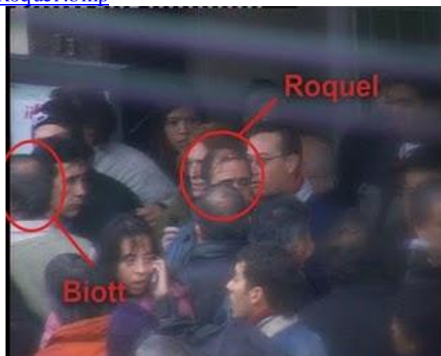
R-Secuen 4-Biott-Roquel .bmp