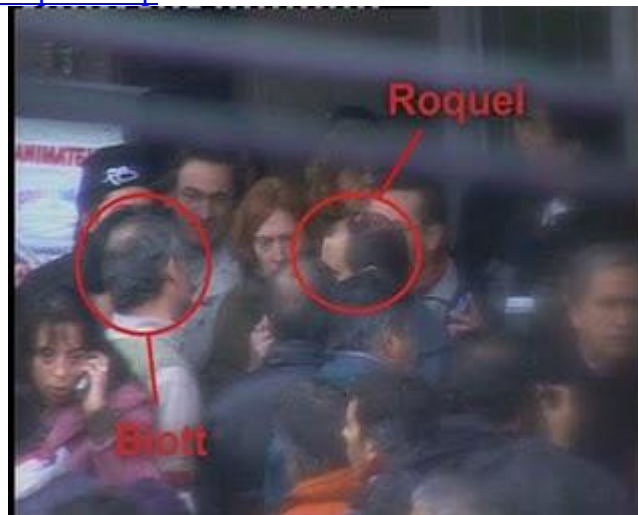
R-Secuen 3-Biott-Roquel .bmp