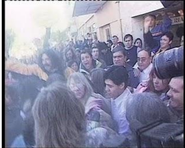
Agresor 1 II- R.bmp