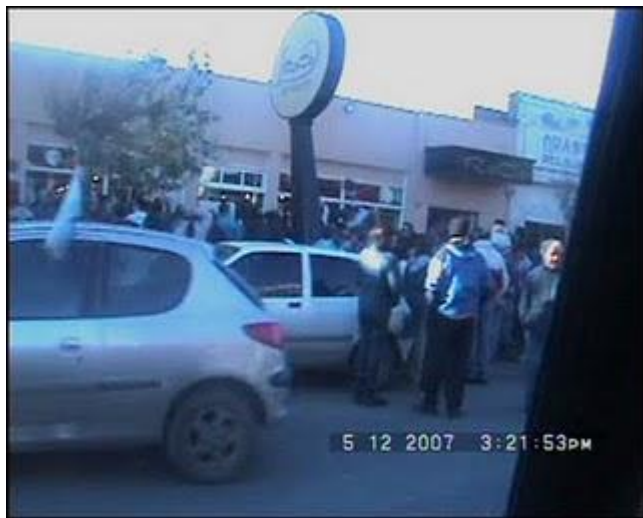
Escrache 12 DIP.bmp