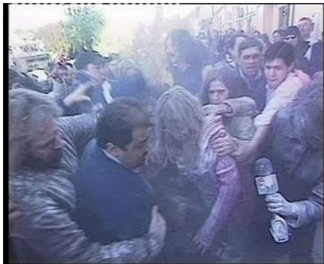
Agresor 2- R.bmp