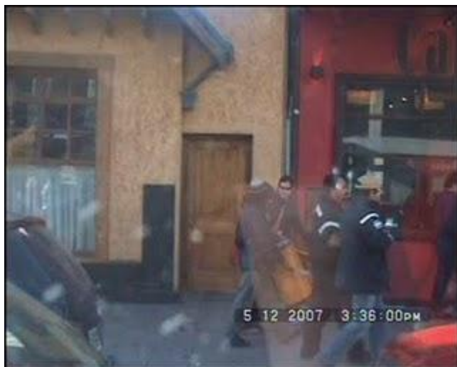
Escrache 13 DIP.bmp