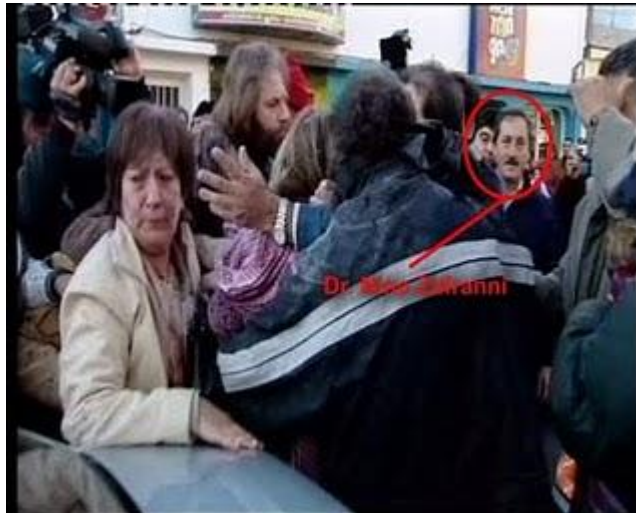
Dr Zafranni y Municipales lesionados.bmp