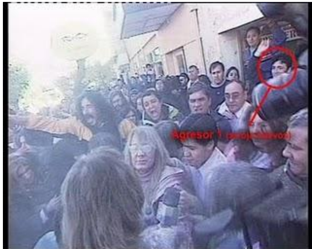
Agresor 1 II.bmp